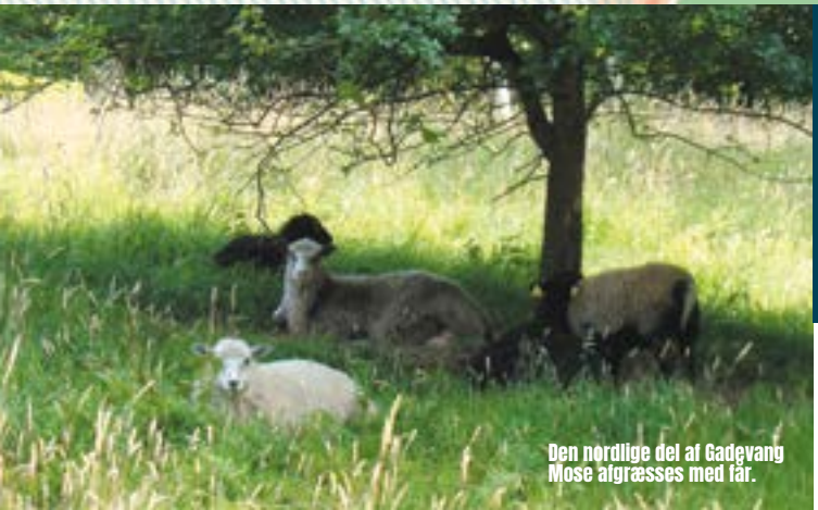
Den nordlige del af Gadevang Mose algræsses med får.